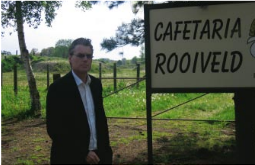
Uitbreiding Rooiveld stuit op zwaar protest.