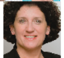
16 ANNEMIE TURTELBOOM