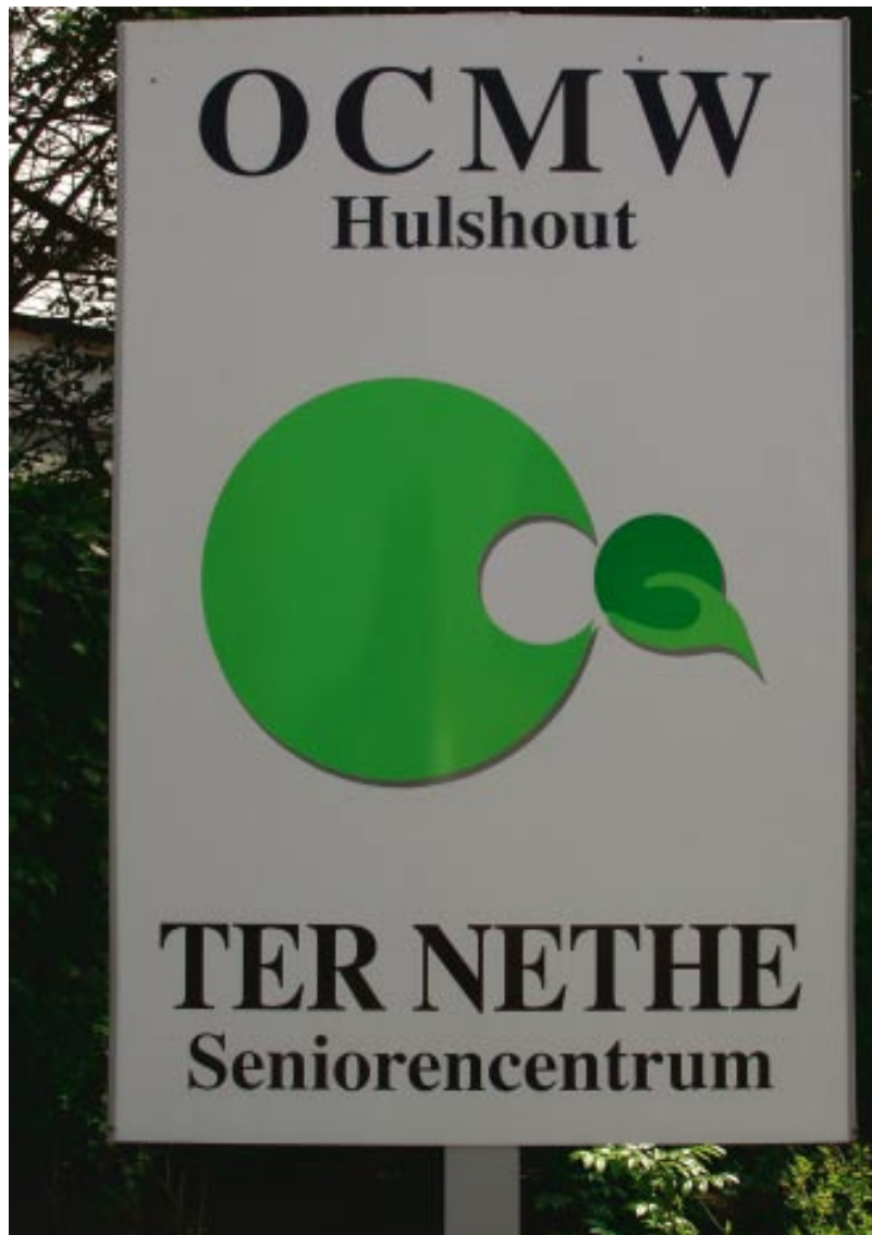
Dit bord wordt straks aangevuld met "gemeentehuis" en "bibliotheek".