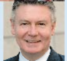
8 KAREL DE GUCHT