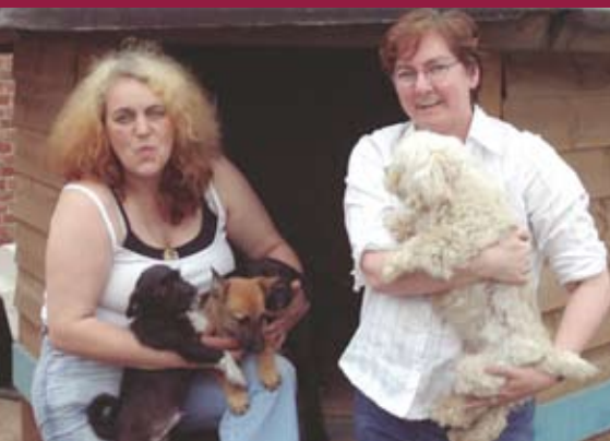
Het "gevecht voor recht" gaat verder.

Dat het allemaal niet juist was en is op het terrein van Unco Jerry is ondertussen wel duidelijk voor iedereen. Maar is de quasi sluiting en het pestgedrag van het bestuur de enige uitweg? Onze partij heeft in mei 2006 Unco Jerry ondersteund met een petitie. Wij ijverden voor het voortbestaan, maar werden daarin niet gevolgd door het bestuur. Open Vld vindt dat een bestuur op 2 verschillende manieren kan reageren op een