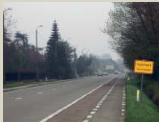
Vanaf hier 90 km/u niet meer verantwoord?

Even wereldvreemd echter is de lineaire maatregel die men uit gemakzucht overweegt om overal op het Hulshoutse grondgebied een maximumsnelheid van 70 km/u op te leggen. Op de Provinciebaan bijvoorbeeld, met zijn zeer brede veiligheidsstroken tussen de rijbaan en het fietspad, is dat toch wel van het goede te veel. Ook voor VLD-Hulshout is verkeersveiligheid zeer belangrijk, maar laten we de automobilist toch niet overdreven betuttelend behandelen. Of zoals iemand tijdens de inspraakprocedure het zei: “Mogen we nog met de auto rijden?” Verdere standpunten over het mobiliteitsplan en het structuurplan vindt u op onze website: www.vldhulshout.be .