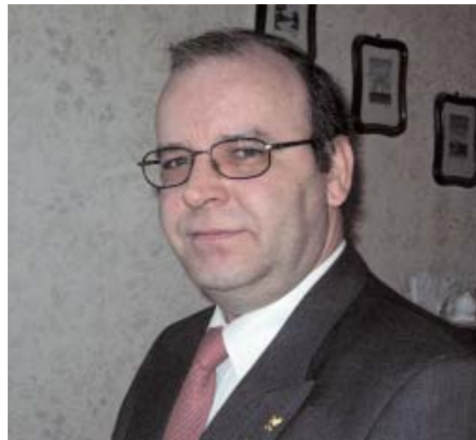
"Een gezond beheer van de gemeentelijke financiën is noodzakelijk"

Een gemiddeld gezin van 4 personen houdt door deze belastingvermindering elk jaar ongeveer 170 euro (6800 BEF) meer over. Wat zou u doen met