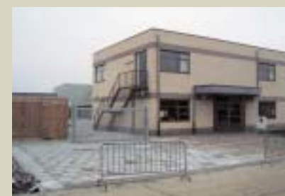
De basisschool Strepestraat kost veel meer dan voorzien.

Echter, de compensatie via de gewone herzieningsclausule is reeds zeer groot en werd in deze verrekening niet mee in rekening gebracht! Bovendien is de toegekende meerprijs ongeveer twee maal zo groot als de prijsstijging die door het Nationaal Instituut voor de Statistiek wordt opgegeven.