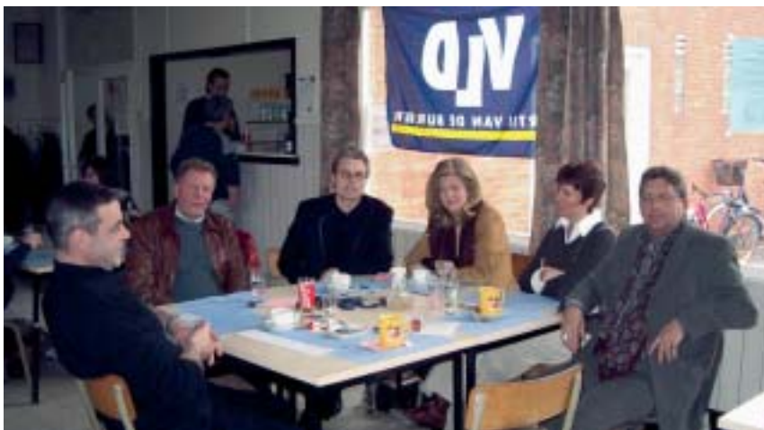
De voorzitters van VLD-Westerlo, Herselt en Sint-Katelijne-Waver op bezoek.

De eerste eetdag van VLD-Hulshout op 13 maart 2005 stond in het teken van “Breughel à volonté”. Dankzij onze twee voortreffelijke ‘chefs’ kreeg iedereen de kans om het buikje à volonté rond te eten. Van de frikadellen werd zelfs twee maal de oorspronkelijk voorziene hoeveelheid bijgehaald en nog moesten de laatste vijf gasten de resterende frikadellen onder elkaar verdelen. Gelukkig was er ook voor hen nog voldoende ander lekkers à volonté.