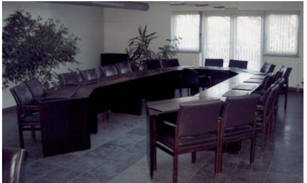
VLD wil inhoud in de gemeenteraad.

Een echte democratie geeft ruimte aan alle meningen, daarom moet in het belang van Hulshout de 'eeuwigdurende' CD&V-meerderheid in vraag gesteld worden. De VLD wil deze aloude meer-