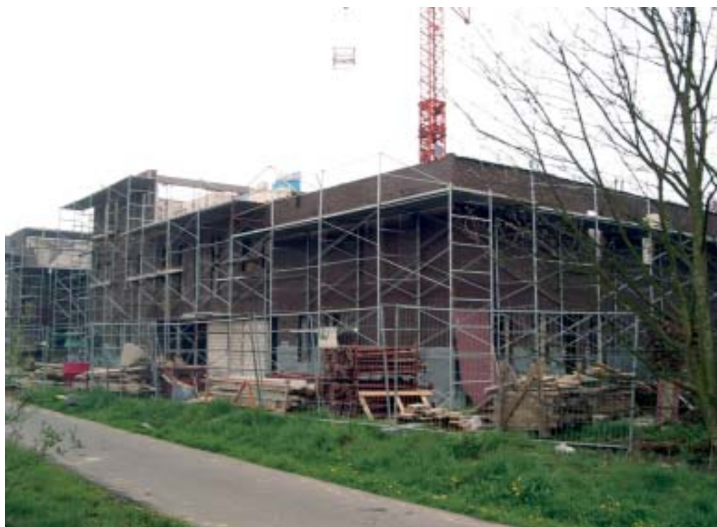
Eindelijk vordert het bouwproces en kan de Hulshoutse jeugd uitkijken naar een eigen stek.

Sinds februari is de werkgroep rond het jeugdhuis druk in de weer met enthousiaste jongeren