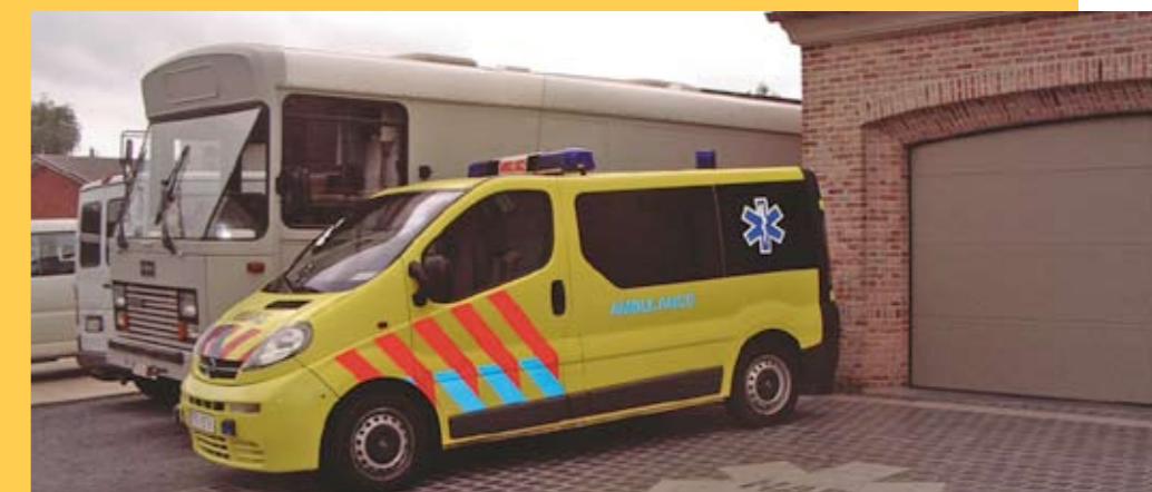
Hulshoutse Ambulance Dienst nog steeds niet erkend als dienst 100.

Ook ik vind dat de brandweer en ziekenwagens van de dienst 100 in Hulshout, Houtvenne en Westmeerbeek aan de minimale normen qua snelheid van interventie moeten voldoen. Daarom stem ook ik op de VLD!