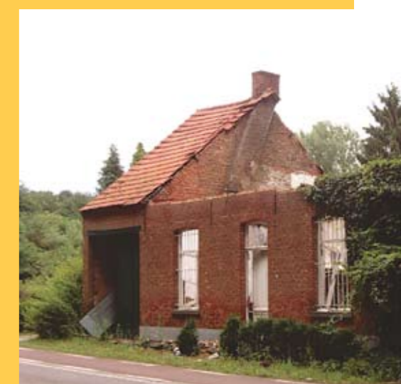
Langs de Heide in Westmeerbeek getuigt deze woning van het huidige beleid: de brandweer kan niet op tijd komen.

Wil je dus verzekerd zijn van een snelle ambulance, hou dan steeds het telefoonnummer van de H.A.D. bij de hand (016/68.08.08), of nog efficiënter: kies voor een ander bestuur in onze gemeente, een bestuur dat de problemen proactief aanpakt in plaats van te wachten tot anderen dit voor hen doen.