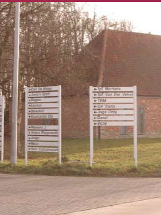
De VLD wil de werkgelegenheid nieuw leven inblazen

Het is dramatisch om zien hoeveel borden “te koop” en “te huur” er staan op het Hulshoutse industrieterrein. Bovendien hebben veel van de bedrijven die er nog zijn, de jongste jaren veelvuldig werknemers afgedankt.