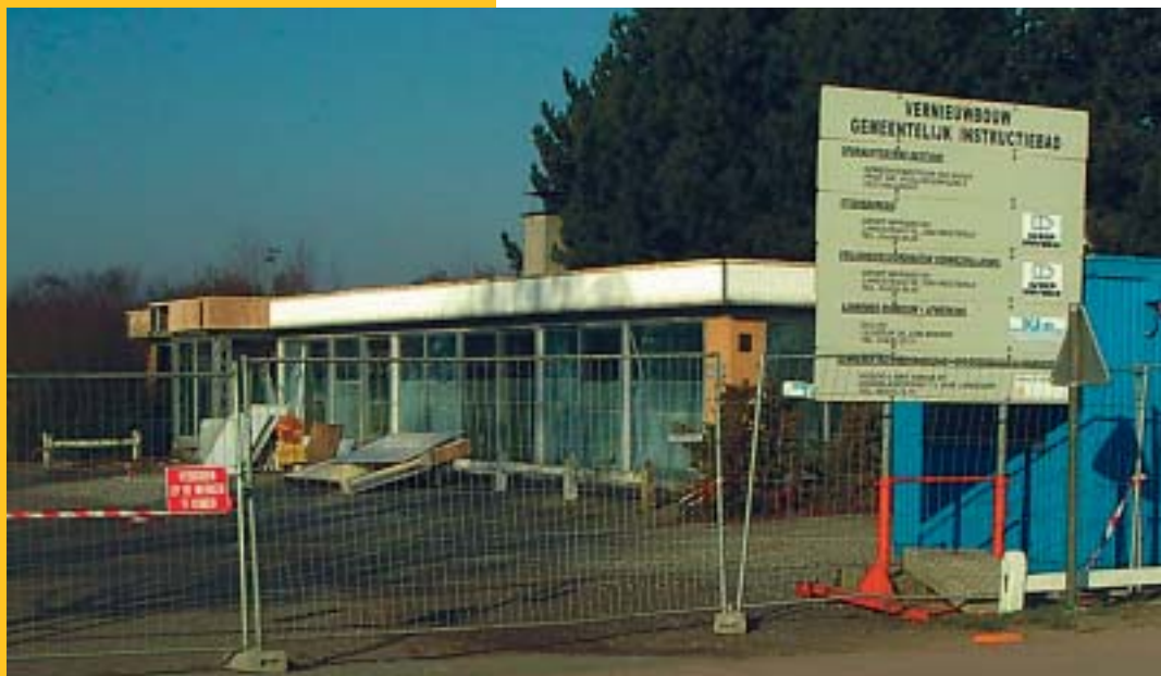
De aanleg van zwembaden in elke gemeente afzonderlijk is puur en klare onzin

Zo'n project vergt echter een degelijke samenwerking over de gemeentegrenzen heen. Maar dat schijnt in onze regio niet echt goed te lukken. De enige zichtbare samenwerking vindt men bij de politie-