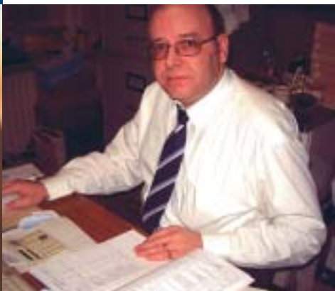
Ernstig omspringen met de zuurverdiende centen van de hardwerkende Hulshoutenaar alstublieft

De VLD zit niet in de gemeenteraad en kan dus enkel van aan de zijlijn toekijken hoe het huidige bestuur aanmodert. Dat bestuur is duidelijk wakker geschrokken van het VLD-programma en presenteerde nu op de gemeenteraad van 19 december een afkooksel van de eisen van de VLD. Het schepencollege stelde een schamele belastingvermindering van 8 naar 7,5% voor.