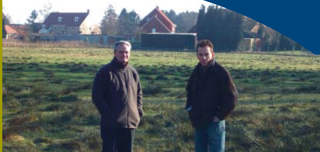
Biezen groeien weelderig op drassige ondergrond

Doe mee met de VLD: fondue en gourmetavond p.12