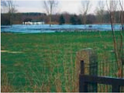
2003: Het water overschrijdt de rechte lijn van de kaart.